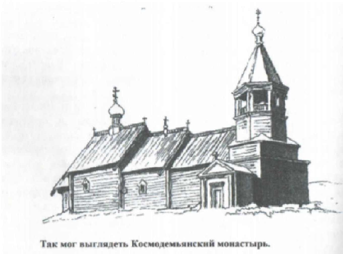
Так мог выглядеть Космодемьянский монастырь.